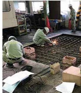
機械移設のための基礎工事