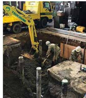
機械設置のための基礎工事